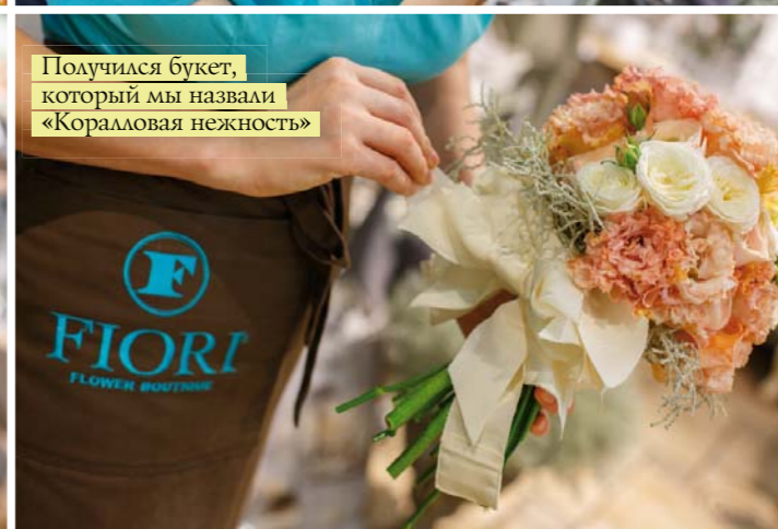
Получился букет, который мы назвали «Коралловая нежность»