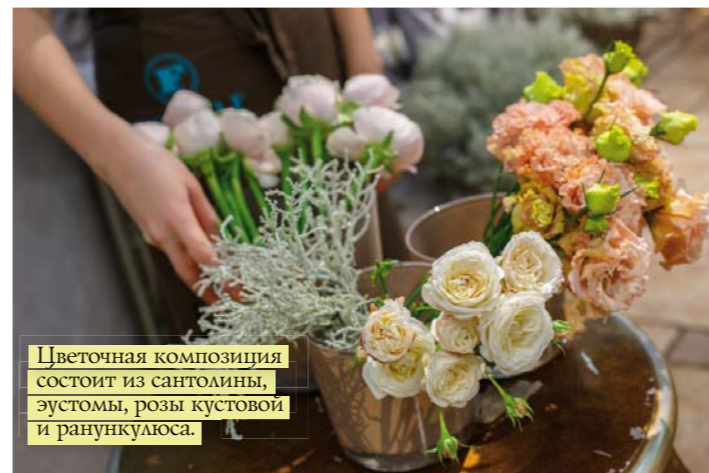
Цветочная композиция состоит из сантолины, эустомы, розы кустовой и ранункулюса.

КАЗАЛОСЬ БЫ, ВСЕ БУКЕТЫ ДЕЛАЮТСЯ ОДИНАКОВО: РАЗ ЦВЕТЧЕК, ДВА ЦВЕТЧЕК, ТРАВКА, ВЕТОЧКА, ВЫЮНОЧЕК... А ПОЛУЧАЕТСЯ ПО-РАЗНОМУ. ТАК В ЧЕМ ЖЕ СЕКРЕТ БУКЕТА? ОКАЗЫВАЕТСЯ, В СВЕЖЕСТИ И КАЧЕСТВЕ ЦВЕТКА И МАСТЕРСТВЕ ФЛОРИСТА