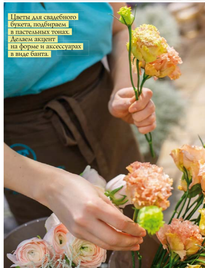
Цветы для свадебного букета, подбираем в пастельных тонах. Делаем акцент на форме и аксессуарах в виде банта.