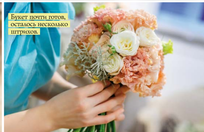
Букет почти готов, осталось несколько штрихов.