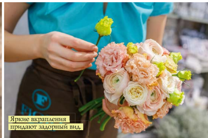
Яркие вкрапления придадут задорный вид.